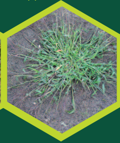
Αιματόχορτο ( Digitaria sanguinalis )