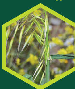
Αγριοβρώμη ( Avena sp. )