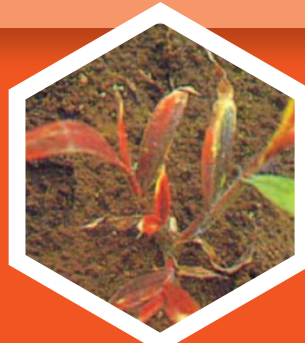
Κοκκίνισμα φύλλων και νεκρωτικές περιοχές στους μεριστωματικούς ιστούς