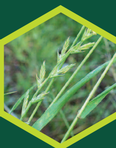
Ήρα ( Lolium spp. )