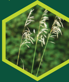
Βρόμος ( Bromus spp. )