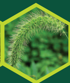
Σετέρια ( Setaria spp. )