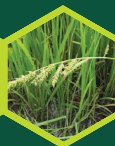
Μουχρίτσα ( Echinochloa spp. )