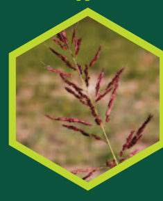
Βέηλιουρας ( Sorghum spp. )