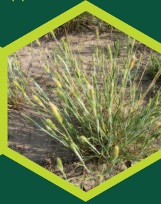
Αλεπονουρά ( Alopecurus spp. )